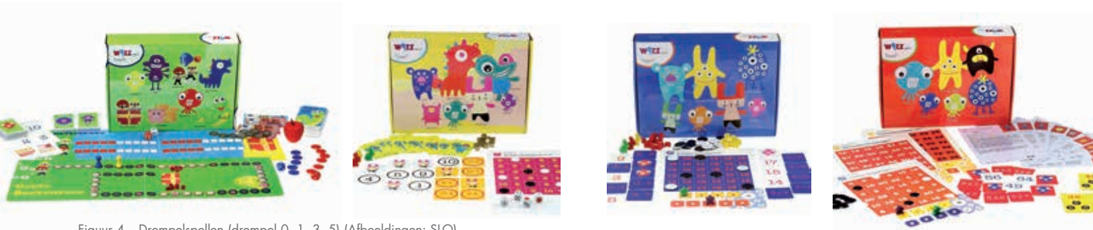
Figuur 4 – Drempelspellen (drempel 0, 1, 3, 5)

aan de drempel werken en met welke spellen. Ook spreken ze af met de leerkracht wanneer ze willen evalueren of ze hun leerdoel bereikt hebben. Ze kunnen zichzelf ook weer toetsen met de Barekatoets of ze evalueren samen met de leerkracht. Regelmatig, kort, afwisselend, motiverend en effectief zijn de woorden die passen bij deze opzet. Dat hoeft niet alleen met rekenspellen,